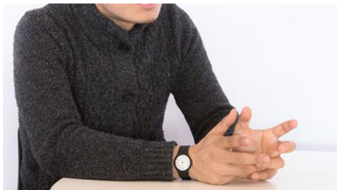
事業や商品・サービス 事業にかける想い 目標 夢・将来像