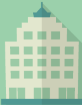
公益産業支援機関