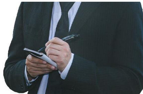
インタビュー取材は、経済ジャーナリストで構成するイノベーションズアイの編集局が行い、企業の価値を的確に伝えます。