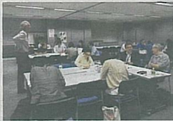
「大田区創業塾」では講義やグループディスカッションを通じて熱心な意見交換が行われる

「大田区創業塾」講師、「大田区ビジネスプランコンテスト」審査委員長、一橋大学大学院国際企業戦略研究科教授（国際ビジネスMBAコース）、米国ニューヨーク州・カリフォルニア州弁護士